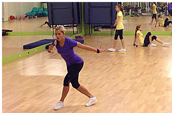
Ladná sportovkyně při nácviu sestavy.

„Důležité je zdraví. Mě zatím za celou kariéru nezklamalo a dělám vše, abych byla fit a ve formě. Pro mne je vrcholem závod, potažmo soutěž samotná. Úspěch spatřuji v tom, že dělám, co mě baví a naplňuje,“ uzavírá pohledná blondýnka.