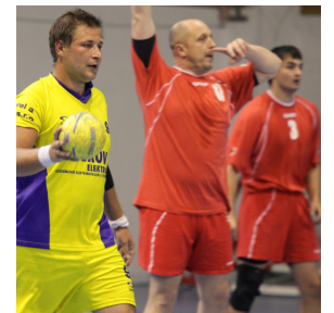
ILUSTRACNÍ FOTO | SOKOLLIBCICE.CZ

Ke známé hale Na Děkanke se nejlépe dostanete pěšky od stanice metra Pražského povstání. Utkání bude rozehráno v 18 hodin. (šaf)